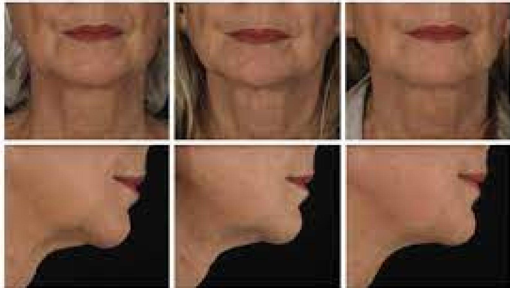
Figure 1 30-year-old female at baseline, January, 2 months and procedure (all in right).