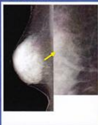
早期発見の微小石灰化

最近日本でも乳がんにかかる女性が急増しています。乳がんは早期発見、早期治療を行うことで、他のがん比べて治りやすいがんです。自己検診を心がける習慣も必要ですが、マンモグラフィで、自己検診では発見できないほど微細な早期のがんを確実に見つけることが治療につながります。